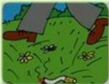
БРОШЕННАЯ СПИЧКА (ОКУРОК)