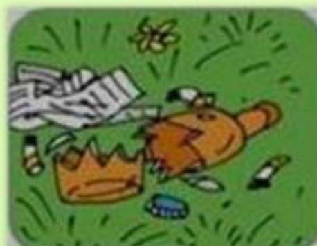
ОСКОЛКИ СТЕКЛА И МУСОР

За нарушение правил пожарной безопасности в лесах предусмотрен АДМИНИСТРАТИВНЫЙ ШТРАФ или УГОЛОВНАЯ ОТВЕТСТВЕННОСТЬ